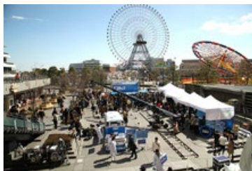
コンサート会場のような大掛かりなセットを通り過ぎる人も見物！

大学生が登場したり、参加者とご当地キャラクターとの撮影会が始まる等、終始和やかなムードで進行。どの方も初めて挑戦する巨大なトランポリンに四苦八苦しながらも、応援の声に乗って、自分らしく楽しんでいたのが印象的でした。