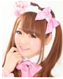
hitomi (メイドカフェ店員)