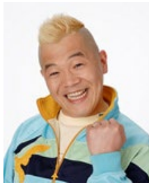
ウド鈴木 (タレント)