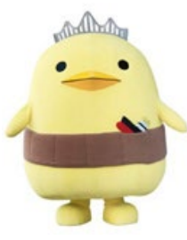
バリィさん (愛媛県今治市)