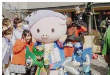
ご当地キャラクターと記念撮影を楽しむ方もおり、終始和やかな雰囲気で行進！