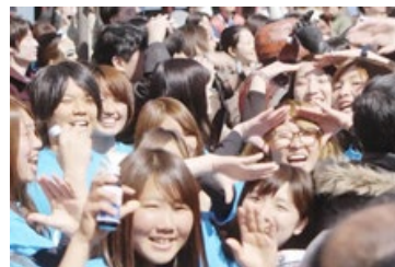
トランポリンに挑戦する人もサンプリングを楽しみにきた人も、会場全体が一体となって応援！