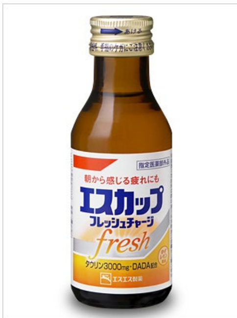
「エスカップ フレッシュチャージ」（指定医薬部外品） （販売名：エスカップD3000）