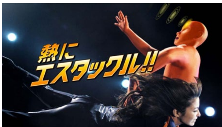
『エスタックイブ FT 』新 TV-CM 「エスタックル」篇（15秒）