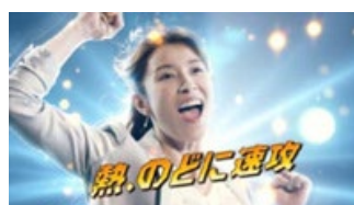
(水野さん) 熱、のどに、速攻!