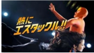
(水野さん) エスタックフル!