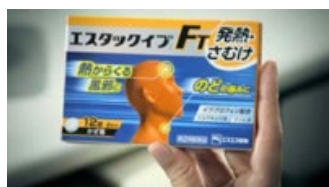
(実況) そんなときは、 エスタック。