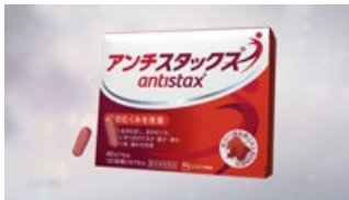
アンチスタックス なら