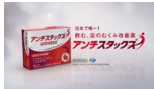
アンチスタックス