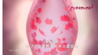
血管を強化し 血流を促進