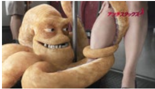
それは中の 問題かも