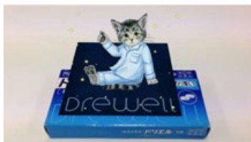
リラックスフミンチ