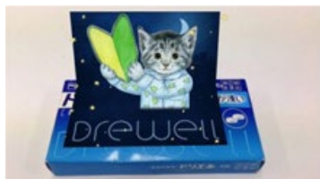
はじめてフミンチ