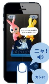
フミンチが出現！ 写真に撮っちゃおう！ かわいいシャッター音にも注目

出現するフミンチは全部で12種類。ランダムに表示される睡眠豆知識や快眠アドバイスなどとの組み合わせにより表示される画像のパターンは7,000通り以上。さまざまなフミンチの世界をお楽しみいただけます。さらに、出現したフミンチを撮影しSNS（Twitter、Facebook、LINE）やメールを使って簡単にシェアすることが可能です。