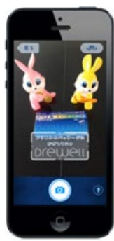
パッケージにかざすと・・・