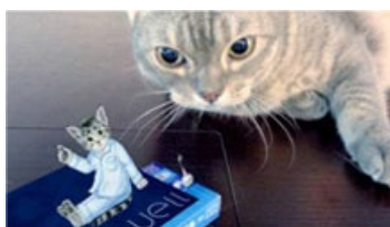
ペットと撮影・・・