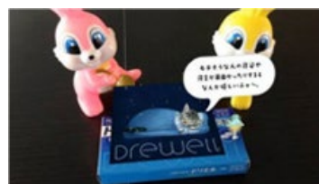
ミニチュアセットと撮影・・・