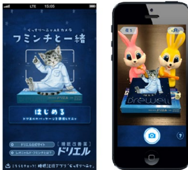
「フミンチと一緒に」画面イメージ

※ARとは、コンピューターやスマートフォンを用いることで現実環境に情報が付加され、新たな映像体験をすることができる技術です。