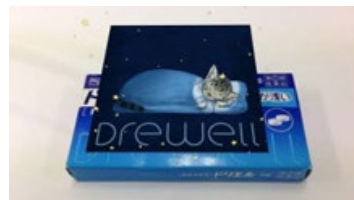
ぐっすりフミンチ