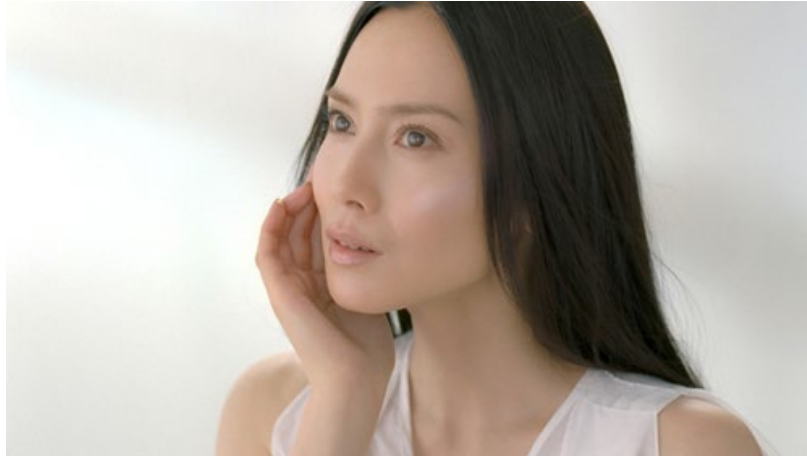
ハイチオールCプラス新TV-CM「その肌の理由」篇（15秒）

エスエス製薬株式会社（東京都中央区、代表取締役会長兼社長：鳥居正男）は、アミノ酸のひとつである「L-システイン」を主成分とする「ハイチオール」シリーズのイメージキャラクターに、女優の中谷美紀さんを約5年ぶりに起用し、新TV-CM『その肌の理由』篇（15秒）を、2012年4月16日（月）から全国でオンエア開始します。