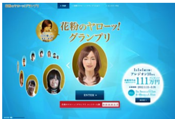
「花粉のヤローッ！グランプリ」トップ画面

「花粉のヤローッ！グランプリ」は、本格的な花粉シーズンの到来を前に早めの花粉対策への意識を高めていただくことを目的として開催します。本キャンペーンは花粉シーズンになってしまいそうな残念な“花粉顔”を自動生成し、周りの方と楽しみながらシェアするとともに、花粉にまつわる失敗エピソードを募集する内容です。3月31日（土）までの期間中に集まった“花粉顔”と“失敗エピソード”作品の中から、最優秀作品にはアレジオン10の特徴である“1日1回1錠”にちなんだ賞金111万円を授与します。なお、本キャンペーンのエントリーにあたって製品の購入は条件ではありません。