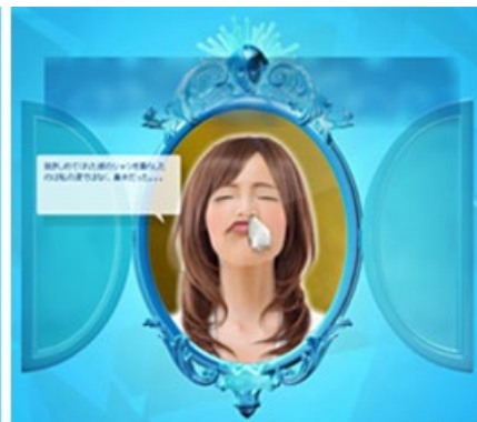
「花粉顔ミラー」で生成される“花粉顔”