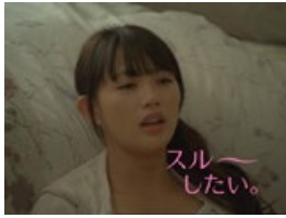
白田さん： スルーしたい。