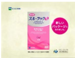
ナレーション： スルーラックS