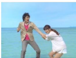
白田さん： 出ずって大切ー！