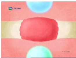
ナレーション： つらい便秘にしっかり効きます。